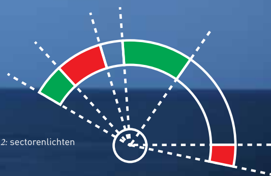
fig 2: sectorenlichten